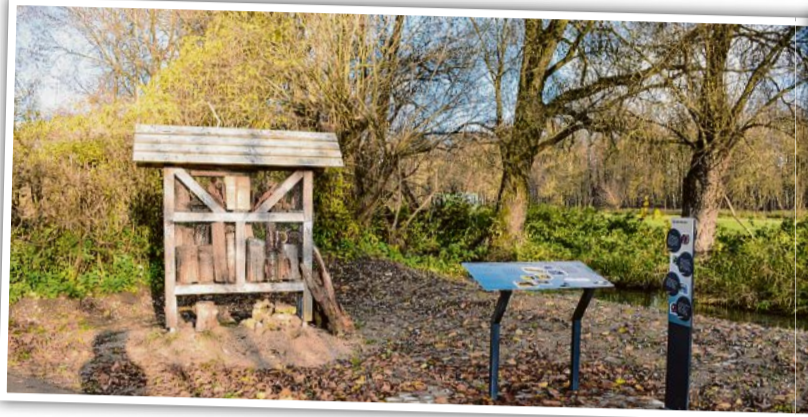
Die Auenweg Station mitten in der Natur.

„Bei der Bürgerbefragung 2019 im Rahmen des Stadtteilentwicklungskonzepts war der Wohlfühlfaktor der Bevölkerung sehr groß“, blicken Siemoneit und Bigos auf das Ergebnis: „Die Wiblinger mögen ihren Stadtteil.“ Im Bereich Wohnen bietet Wiblingen für alle etwas – also für jeden Geschmack und jedes Budget. Vom Einfamilienhaus im Grünen über Mehrfamilienhäuser bis hin zur verdichteten Bebauung reicht das Angebot.